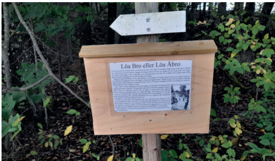
De promenadstigar i olika färger, som Sportklubben och Hembygdsföreningen stakat ut ger möjlighet till en mycket fin vandring i Bergslagsnatur. Tanken har länge varit att ge mer information till vetgiriga vandrare. Nu har informationstavlor börjat komma på plats.

Stigen längs ån kommer småningom fram till en skylt som berättar om tackängen på andra sidan. Där har varken tackor eller baggar gått och betat. Det var järntackor från hyttan som lagrades där i väntan på att de kunde ros till Rällså station med järnekan Bismarck.