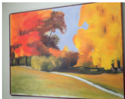
Höstvy från Djurgården

Det är lite stökigt i kaféet när Löa-Bladet tittar in. Golvet hållar på att läggas om och bänkar, kylskåp och möbler är flyttade utmed väggarna. Men här och var