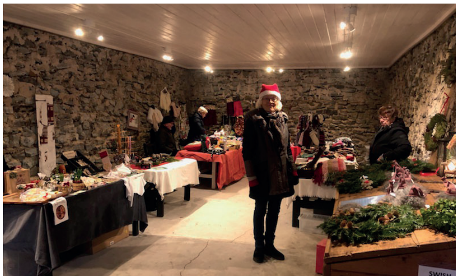
Mindre blåst och mer julstämning var det inne i marknadsgalleriet

En affisch med pris och swishnummer kommer att sättas upp bredvid granarna och hugade köpare kan gå dit när det passar.