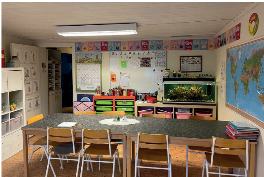
Det ser lite tomt ut så här års förstås, men det fylls säkert på till hösten, det är många som är intresserade av att gå i Löa förskola och skola