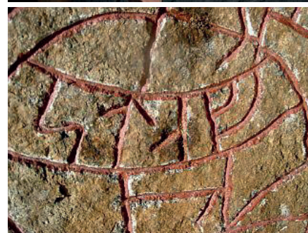
Staffans ristarssignatur är STAF