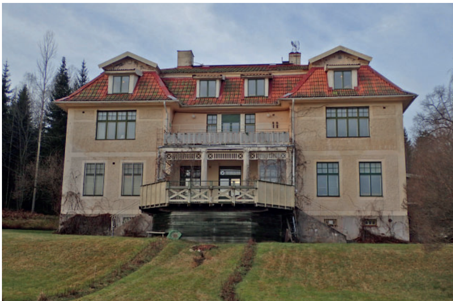
Det här huset ligger inte i Löa, men det ägs numera av en Löabo och får därför självklar plats i Löa-Bladet.