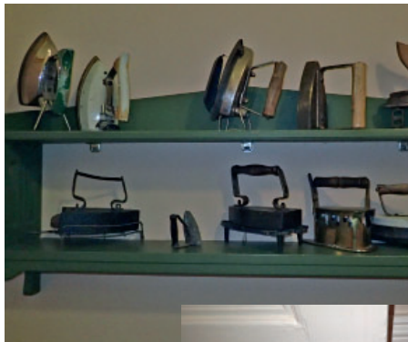
Gamla strykjärn kan användas som dörrstopp och i källaren kanske det kan bli ett radiomuseum.

Bergslagen Hotell & Konferens är på väg att etableras.