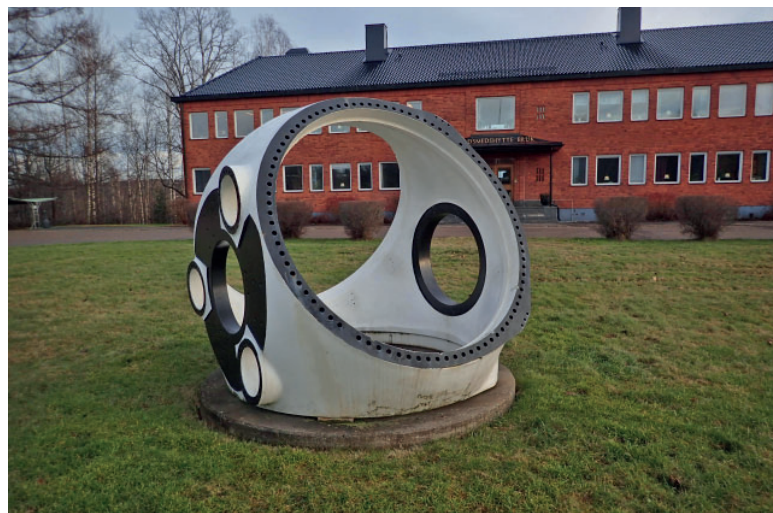
Ett vindkraftsnav, som idag gjuts i Guldsmedshyttan kan också användas som staty utan för det gamla brukets kontor.