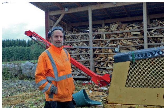
Aeodynamisk civilingenjör jobbar gärna med trä också.

Det är dräktiga ston från Linköping och Stockholm, som blir de första hyresgästerna här. Så till våren kan de som passerar Samuelsdal (v g sänk farten!!) se söta små föl stappla/skutta/kesa (eller vad nu små föl gör?) i hagarna däromkring.