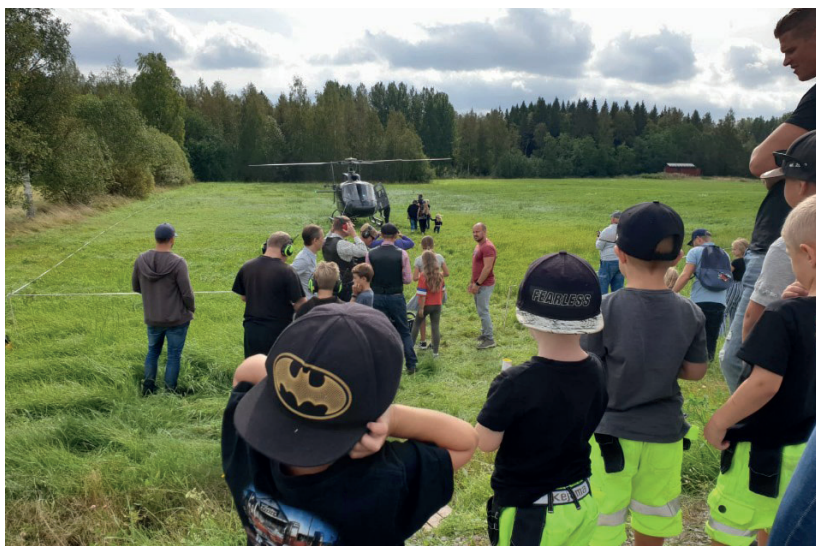
Kön till helikoptern var också lång.

Korven tog också slut och Klas Gustafsson kom knegande uppför backen med en stor korvburk under armen. Även