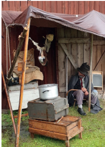
Luffaren Fargo lyckades bestämt koka en strumpa i vattnet i sin gryta.

Barnen fick samla vattenpärlor och lära sig en del om vattnets vikt under årets vandring. Och sedan kunde alltihop sluta i synnerligen modern tid med en utställning