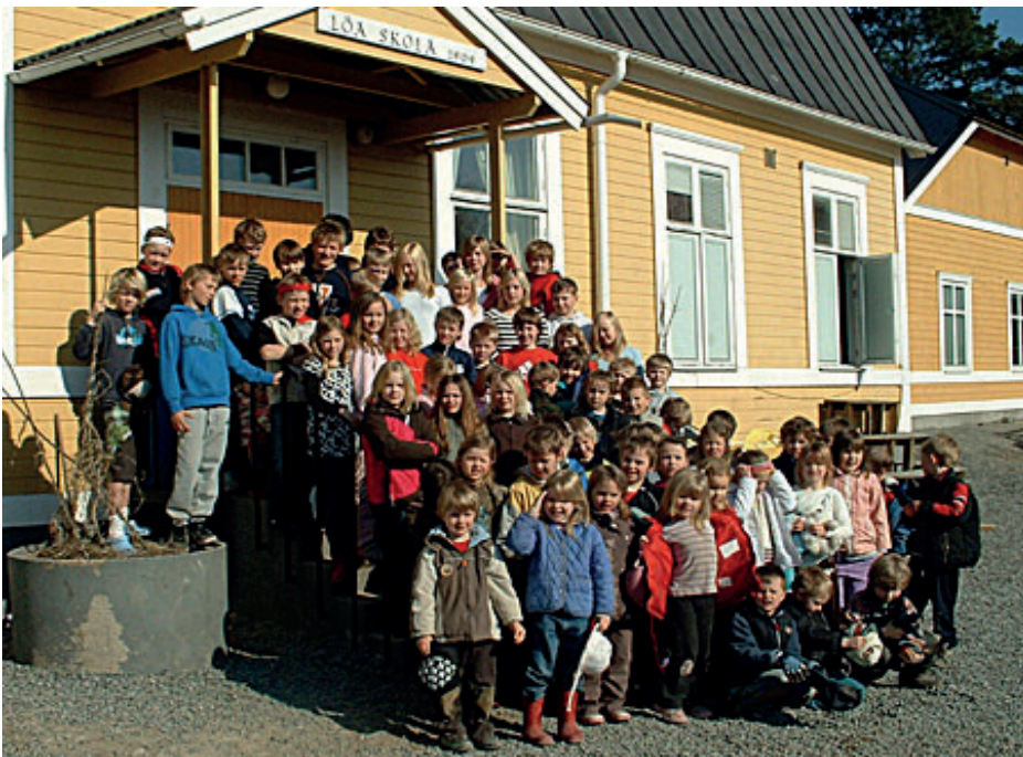
Löa Friskola startade 1993 med 38 elever. Idag går 99 elever i skolan och 52 barn är inskrivna på Trollebo förskola. Bilden är från 2008.