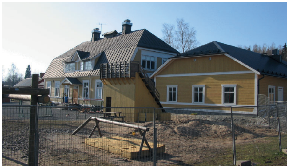
Löa Skola fick lov att byggas ut 2007, för att få plats med alla elever.