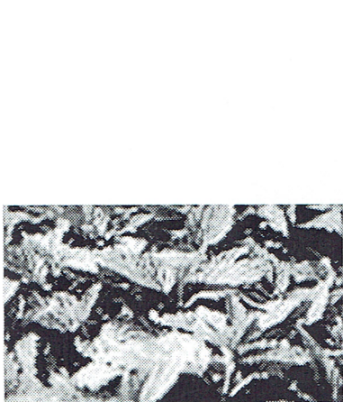
Brännässla ( Urtica dioica )