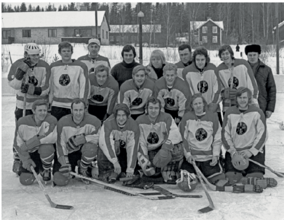
Mellan åren 1961 och 1972 deltog LSK i serier i ishockey. Bilden torde vara tagen någon gång då. Löa-Bladet överläter dock till läsarna att känna igen och namnge spelarna.