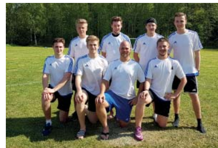
LSK i modernare tappning.

Den synnerligen aktiva 90-åringen, Löa Sportklubb, kommer att hyllas särskilt i samband med årets Löiad den 28 augusti.