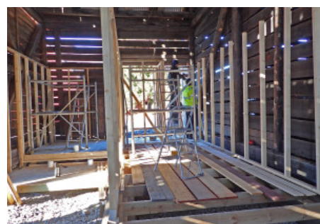
Men inuti kommer det ju inte att precis se ut som ett kolhus längre.

Filmad teater kommer också att finnas tillgänglig för besökarna. Towe Dam har klippt ihop en film från Trollstigen, som tidigare var sommarens teaterevenemang i Löa. Den kommer att visas inne i museet. En lekhörna där barn kan få bekanta sig med lite äldre leksaker som stylvor, tunnband, trädockor mm planeras också.